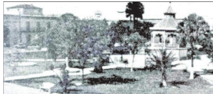
Las imágenes de archivo muestran a la ciudad de Matamoros, México. Al centro el autor Rudy Ruiz, y la portada de su libro “Seven for the Revolution”.